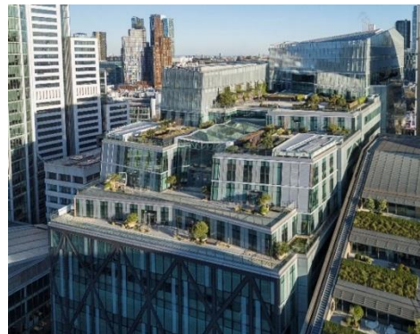
21 ムーアフィールドズ（21 Moorfields）の外観（左・右）