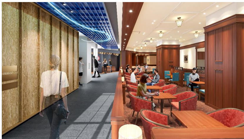
「THE YOKOHAMA FRONT」商業エリア2階 （イメージのため実際と異なる場合があります）