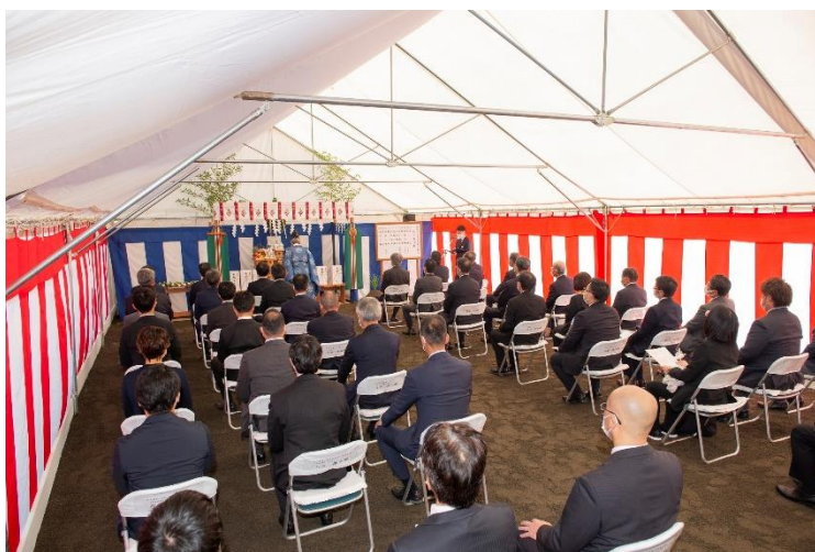
「ゆめが丘大規模集客施設」起工式の様子