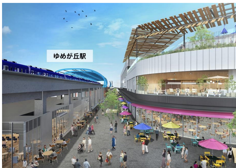
「ゆめが丘大規模集客施設」(イメージ)