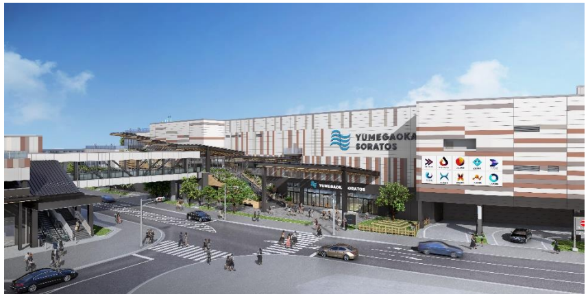
「ゆめが丘ソラトス」イメージ