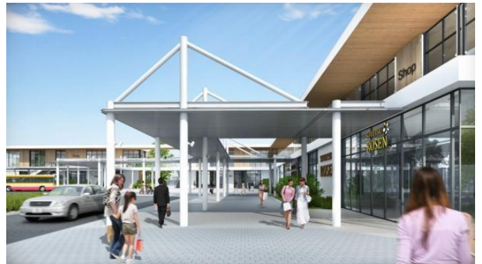
アーケードのイメージ（実際と異なる場合がございます）