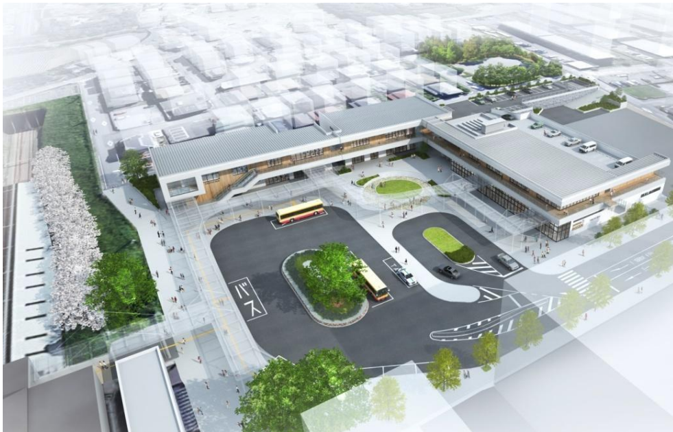
「相鉄ライフ やよい台」全体イメージ (実際と異なる場合がございます)