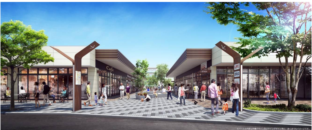
全面開業後のイメージ